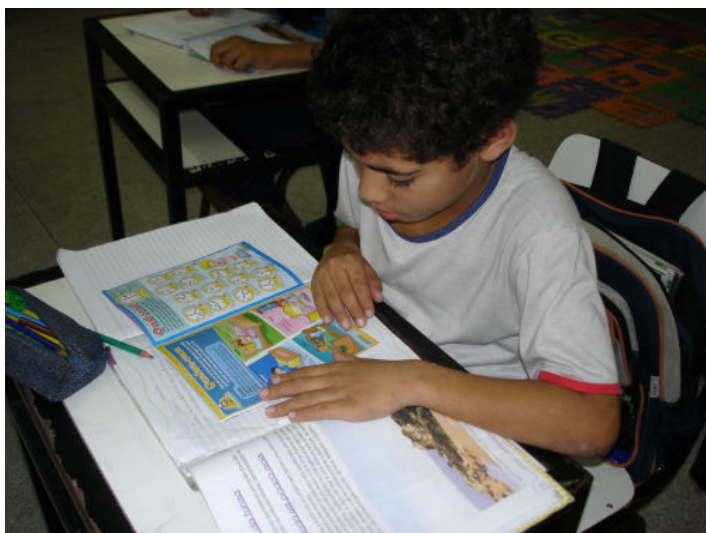
Foto 4 – Algumas burlas e artimanhas dos alunos. Aproveitam o tempo para suas descobertas mesmo sem a “autorização” da professora

“Os amigos trazem brinquedo, diário, livros... Eu não gosto de trazer, porque a professora briga. A professora deixa brincar, quando acaba o dever e sobra um pouquinho de tempo. Aí a gente brinca... ou, então, na aula de Educação Física, ou no passeio.” (A)