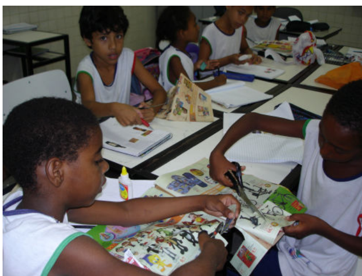
Foto 3 – Professora trabalhando resolução de problemas a partir de encartes de jornais

Como bem ensina Certeau (1994), eles o fazem por meio de burlas, artimanhas, usos, táticas e vão criando maneiras de fazer e usar (ler, produzir, jogar, conversar). Perguntei também se as professoras aproveitavam o que eles traziam. Eles afirmaram: “ Usam em aula mais os livros e revistinhas ”. Acrescentaram que esses materiais são utilizados principalmente depois que eles terminam o dever, ou na hora do recreio. No entanto, confirmaram que as professoras traziam para as aulas recursos como livros, jogos, revistas, jornais, CDs. Consideravam que esses materiais tornavam a aula mais interessante, o que favorece a aprendizagem.