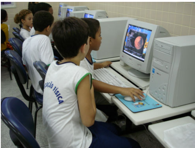
Foto 1 – Alunos no Laboratório de Informática trabalhando o Projeto Planetas

“Aprende muito mais, porque lá, na Informática, a professora consegue falar com os alunos, coloca ordem na gente, e todo mundo fica quieto e, na sala, quando é só para fazer o dever, a professora quase não fala, porque os alunos gritam.” (A)