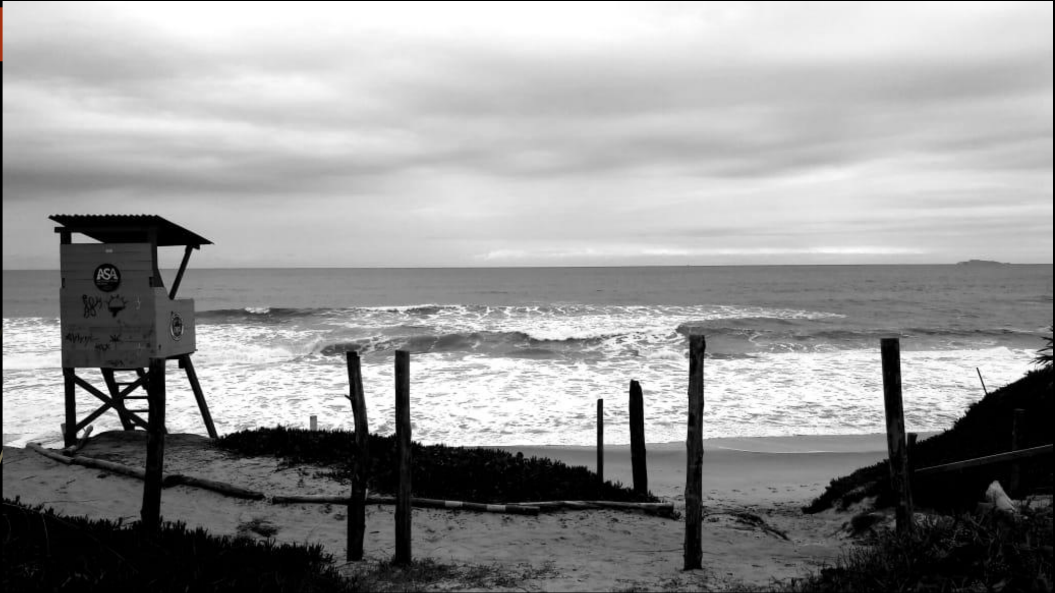
Fotografia. Acervo pessoal, 18/06/2021.