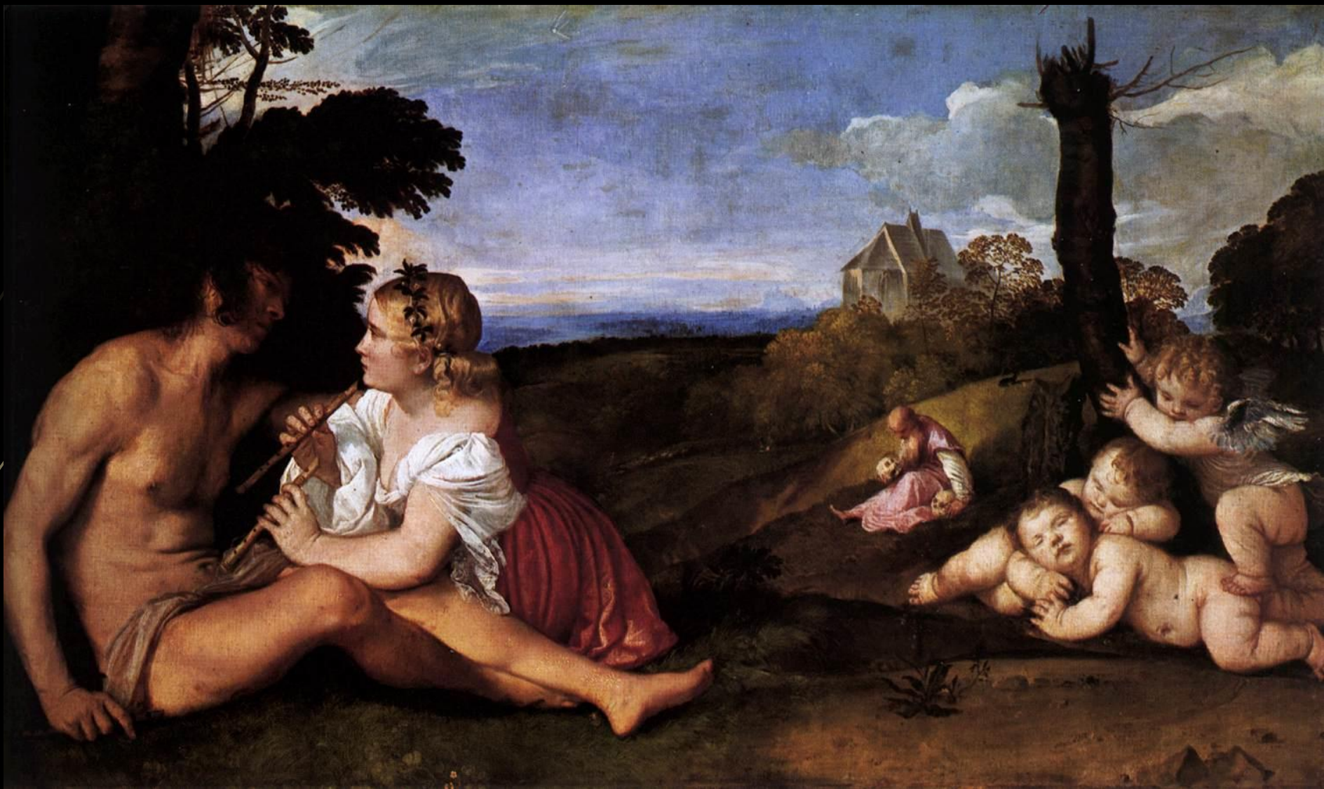
Ticiano - As Três Idades do Homem (1512-1514). Óleo sobre tela. Galeria Nacional da Escócia. Domínio público.