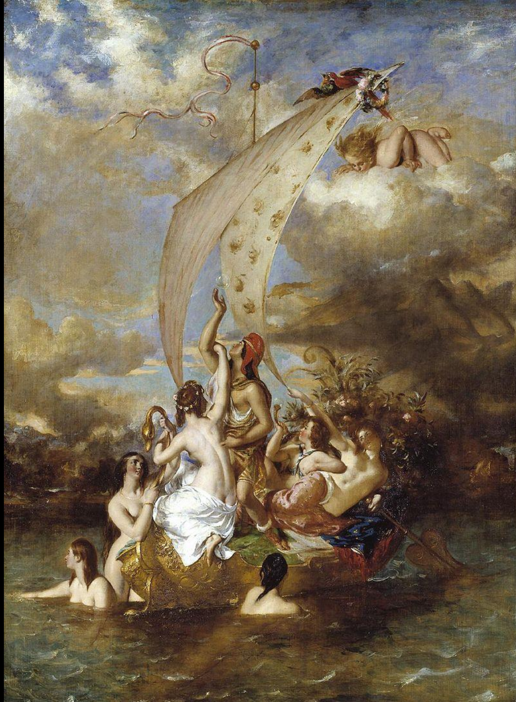
William Etty - A juventude na proa e o Prazer no Leme. Óleo sobre tela. 1832.