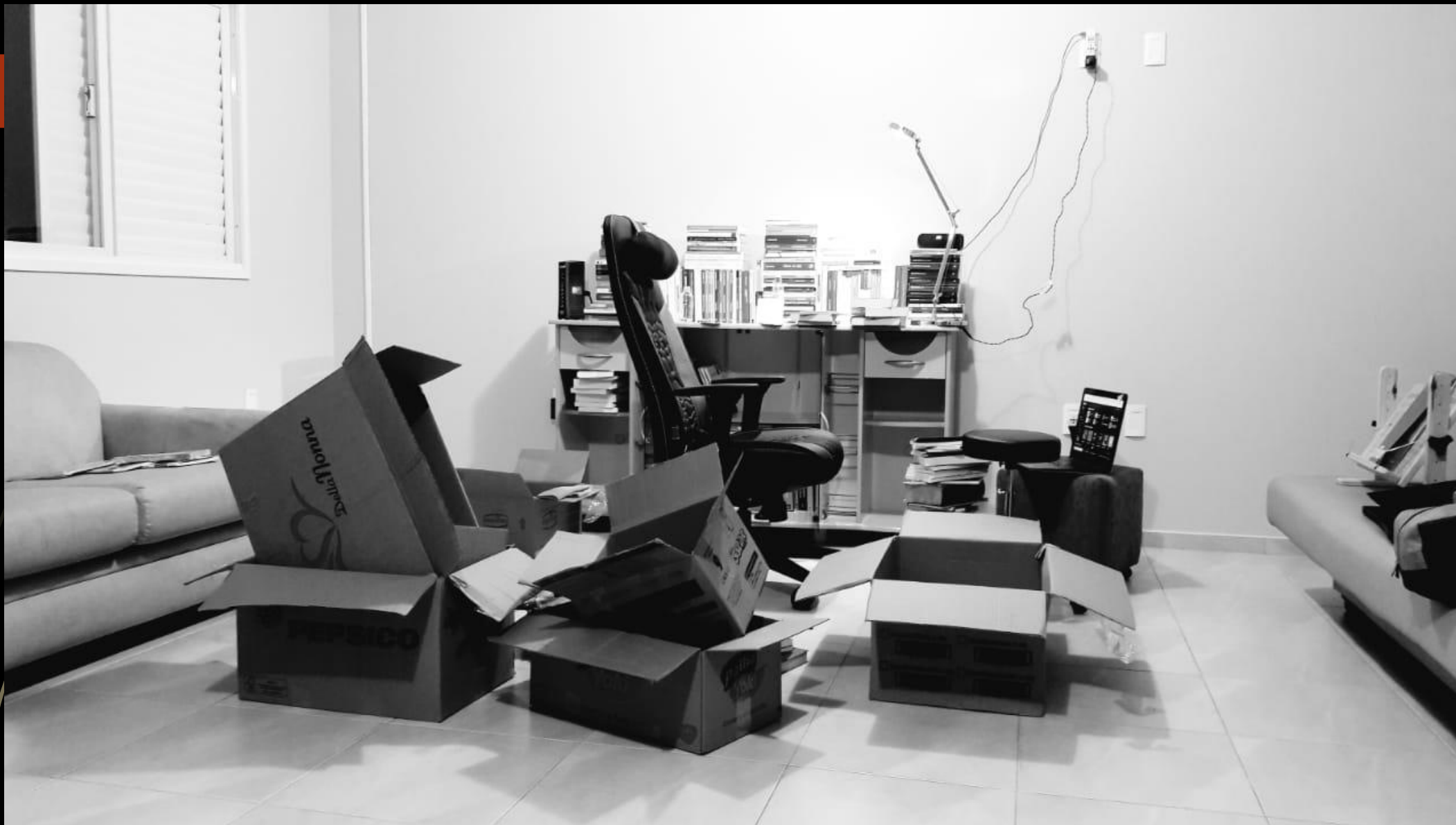
Fotografia. 19/06/2021.